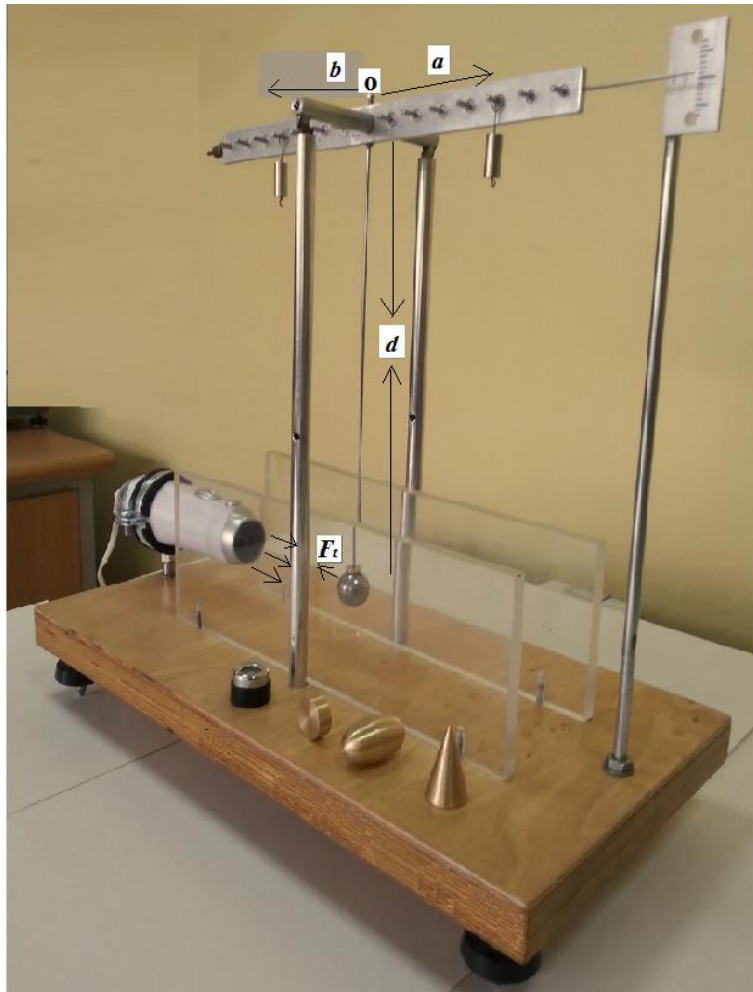
Rys. 3. Układ pomiarowy do określania wartości współczynników oporu ośrodka dla ciał o różnych kształtach

Ramiona a , b i d , siła oporu ośrodka F_i określana dla kuli, dysku, elipsoidy i stożka.