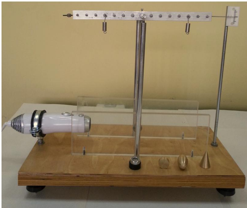
Rys. 2. Schemat układu

Jeżeli za referencyjny kształt ciała wybierzemy kulę, to dla ciała w kształcie kuli siłę oporu F_{tk} określimy jako: